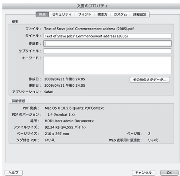
図 3 Adobe Acrobat でのプロパティの確認 (2)