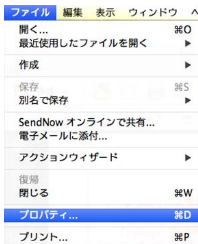
図2 Adobe Acrobat でのプロパティの確認 (1)